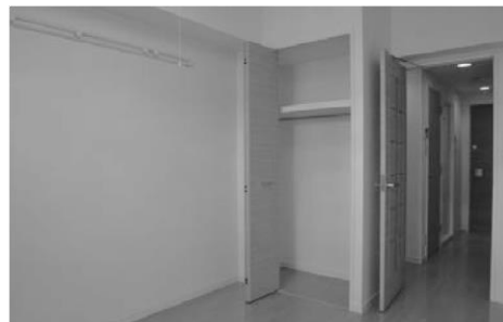
居室・クローゼット