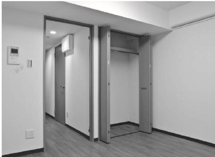
居室・クローゼット