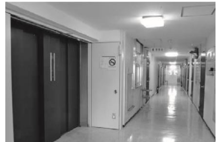
エレベーター・廊下