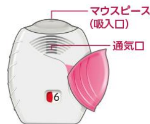
カバーを開けた状態